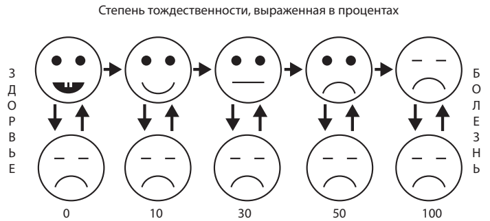
Рис. 1 – Метод распознавания образов в донозологической диагностике основан на определении подобия изучаемых объектов

Перед врачами и педагогами встает проблема охраны нервно-психического здоровья школьников, а это, в первую очередь, осуществление системы психологических мероприятий. К таким