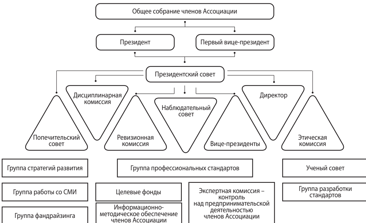
Схема 2. Структура управления Национальной СРО «Союз психотерапевтов и психологов»

Помимо стартового выпуска, к настоящему моменту в свет вышло 4 выпуска Антологии. Выпуск № 1 содержит материалы Международного конгресса «Психотерапия, психофармакотерапия, психологическое консультирование. Грани исследуемого», прошедшего 17–18 марта 2017 г. в Санкт-Петербурге. Выпуск № 2 включает материалы II международного конгресса помогающих профессий, состоявшегося 21–23 сентября 2017 г. в Уфе. Выпуск № 3 посвящен материалам Итогового международного конгресса года «Возможности психотерапии, психологии и консультирования в сохранении и развитии здоровья и благополучия человека, семьи, общества», успешно проведенного 12–15 октября 2017 г. в Москве. В выпуск № 4 входят материалы Всероссийского конгресса с международным участием «Отечественная психотерапия и психология: становление, опыт и перспективы развития (к 85-ле-